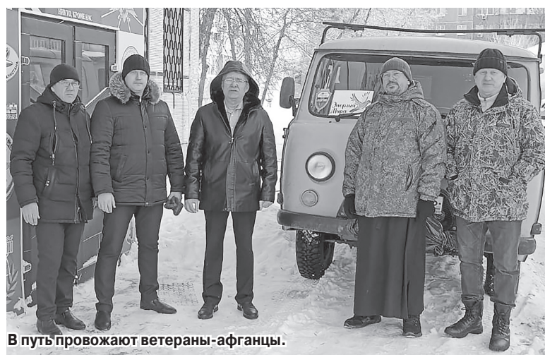
В путь провожают ветераны-афганцы.

сейчас все встает на свои места. Люди задумались о смысле жизни - не той, которая лучше, богаче, а о ценности самой жизни, самых обычных вещей.